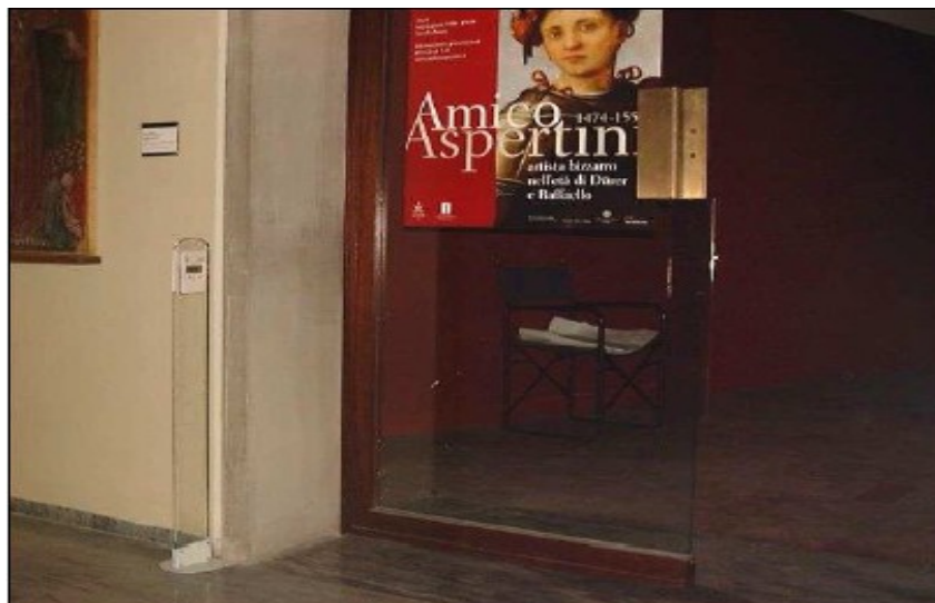
Esempio di installazione presso la Pinacoteca Nazionale – Bologna

KIT Contapersone SMARTCHECK CMR da interno, a doppio raggio infrarosso, con memoria SD 2 GB, lettore di memoria e Software CHECKIN LITE per statistiche, montato su 2 colonnine in plexiglas, pronto a funzionare in un minuto. Installazione a cura del destinatario. Senza cavi, senza toccare pareti, a costi di installazione ZERO.